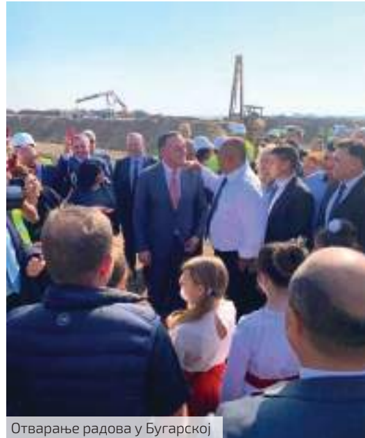
Отварање радова у Бугарској