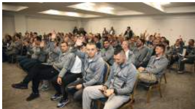
Велики одзив наших спортиста на годишњу седницу Скупштине клуба