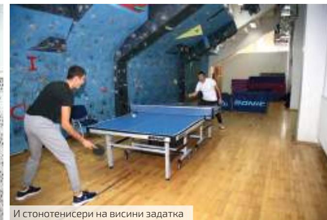
И стонотенисери на висини задатка

прилагодимо новим околностима. Једна од тих, нових, околности биће и нова организација пословања ЈП „Србијагас“.