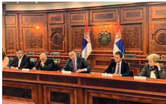
Министар са сарадницима и представницима Србијагаса и ЕПС-а, са ММФ-ом

Такође, једна од тема састанка била су и будућа решења за предузеће „ХИП – Петрохемија“ а.д.