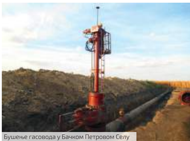
Бушење гасовода у Бачком Петровом Селу

Када је реч о пословима који су пред њима, директор Сектора техничке подршке најављује да ће Служба електроодржавања у новембру радити катодну заштиту на доводном гасоводу од Шепка до Бијељине, у дужини од око 20 километара. У склопу тих послова, ту ће се поставити и две станице и 20-так контролно-мерних извода, стубића, што је посао који ће наше електричаре ангажовати бар 10 радних дана. Машинску службу треба да позавршава све оне послове који су били на чекању док су се радили велики послови на терену.