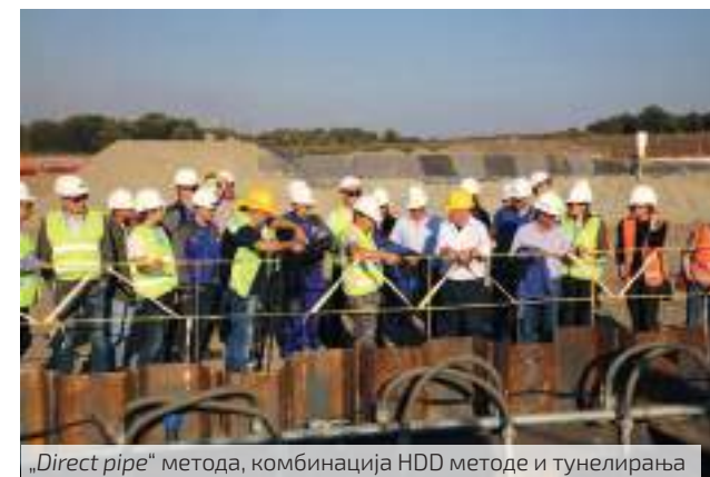
„Direct pipe“ метода, комбинација HDD методе и тунелирања