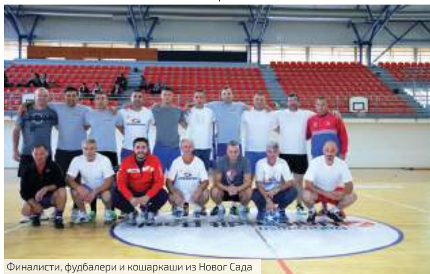
Финалисти, фудбалери и кошаркаши из Новог Сада

ово је рекреативни спорт, овде је циљ одржавање физичке спреме, превентива професионалних обољења, а спортски резултати јесу важни, али не смеју никада да буду на првом месту. Похвалио бих и хотел „Фонтана“, који нам је у много чему изашао у сусрет, тако да је све протекло у најбољем реду. Да ли је било пропуста? Има их и на Олимпијским играма, али оно што смо уочили сада као пропусте, анализираћемо у новембру, на заједничком састанку Извршног одбора клуба са капитенима и тада ћемо усвојити и Програм рада клуба за наредну годину. Можда је време да неке ствари мењамо и