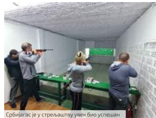
Србијагас је у стрељаштву увек био успешан