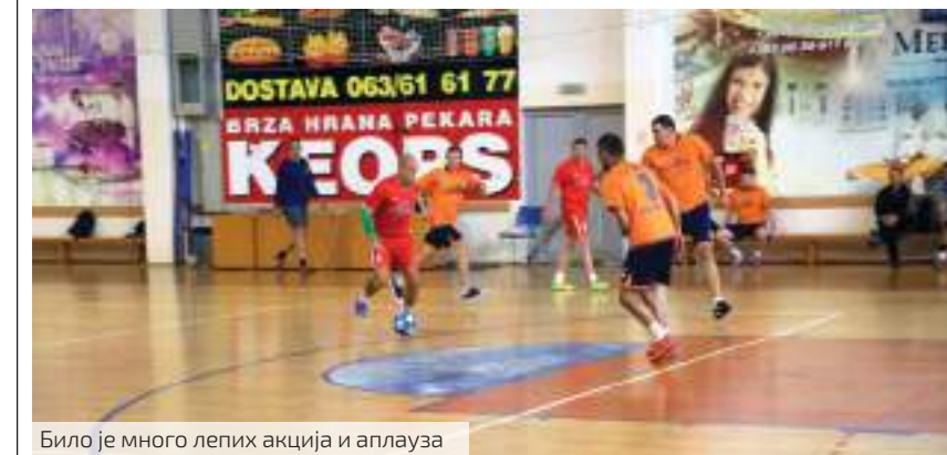
Било је много лепих акција и аплауза

• Како гледате на значај нашег Спортског клуба, значај бављења спортом и рекреацијом, какве су шансе да се велика спортска екипа Србијагаса још увећа, подмлади?