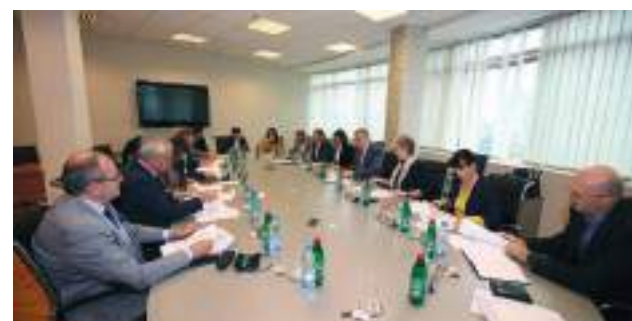
На дневном реду Извештај о пословању од јануара до септембра 2019.