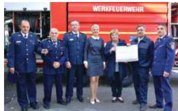
Наши Елемирци и немачки хуманитарци испред поклоњеног возила