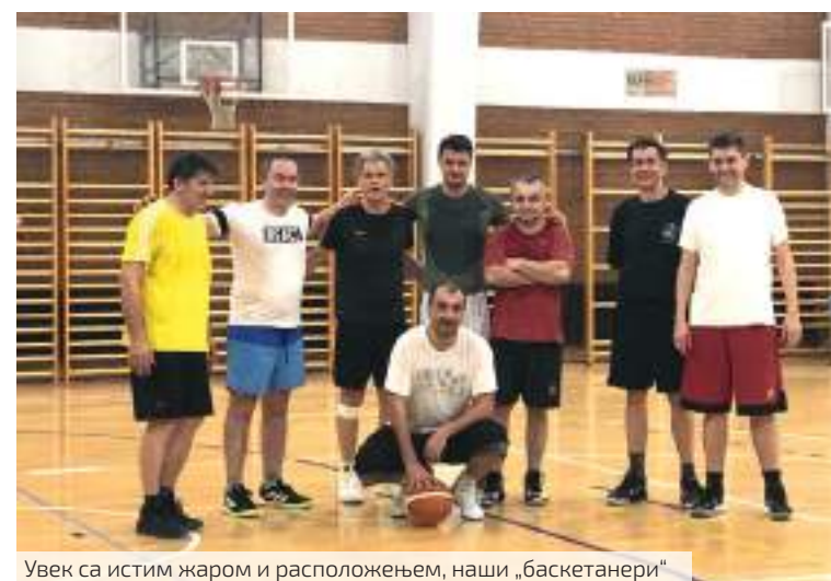
Увек са истим жаром и расположењем, наши „баскетанери“