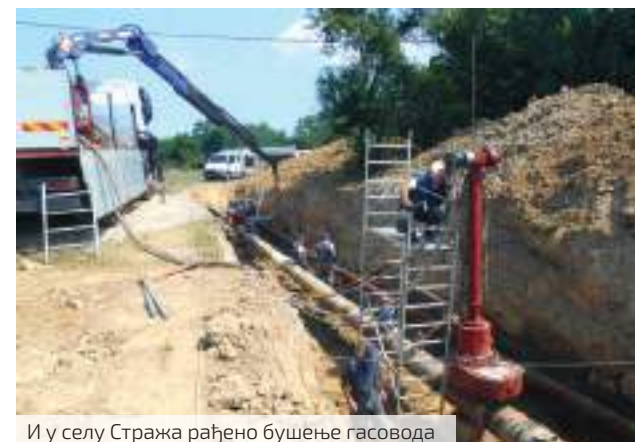
И у селу Стража рађено бушење гасовода

- У том случају остаје да се „браниш“ разним мерама противпожарне заштите. Било је, заиста, веома опасно, нарочито при сечењу старог и заваривању новог дела гасовода, када је и ризик од експлозије, због концентрације, највећи. На два места смо санирали оштећења, у дужини од 15 метара на једном и око 50 метара на другом месту. Дакле, велики пречник, дугачка деоница, велика запремина и притом изузетна концентрација гаса, све су то укратко карактеристике