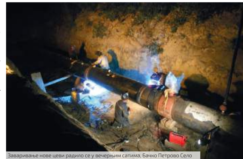
Заваривање нове цеви радило се у вечерњим сатима, Бачко Петрово Село