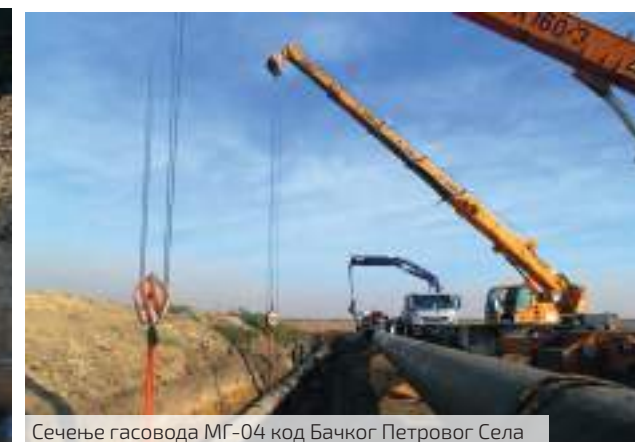
Сечење гасовода МГ-04 код Бачког Петровог Села