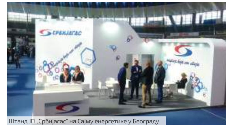
Штанд ЈП „Србијагас“ на Сајму енергетике у Београду