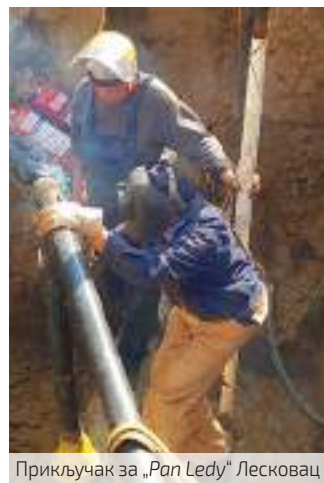
Прикључак за „Pan Ledy“ Лесковац

Под гасификацијом Вождовца подразумева се извођење радова на гасоводу средњег притиска у дужини од 30.000m, дистрибутивној гасној мрежи дугачкој 490.000m, изградњи 12 МРС, као и 1.500 кућних гасних прикључака. Колега Зирић напомиње да и овде Србијагас, као инвеститор, обезбеђује полиетиленске цеви, надзор и финансијска средства. Укупна вредност инвестиције је 19 милиона евра, а рок за завршетак радова је крај 2023. године.