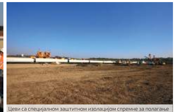
Цеви са специјалном заштитном изолацијом спремне за полагање