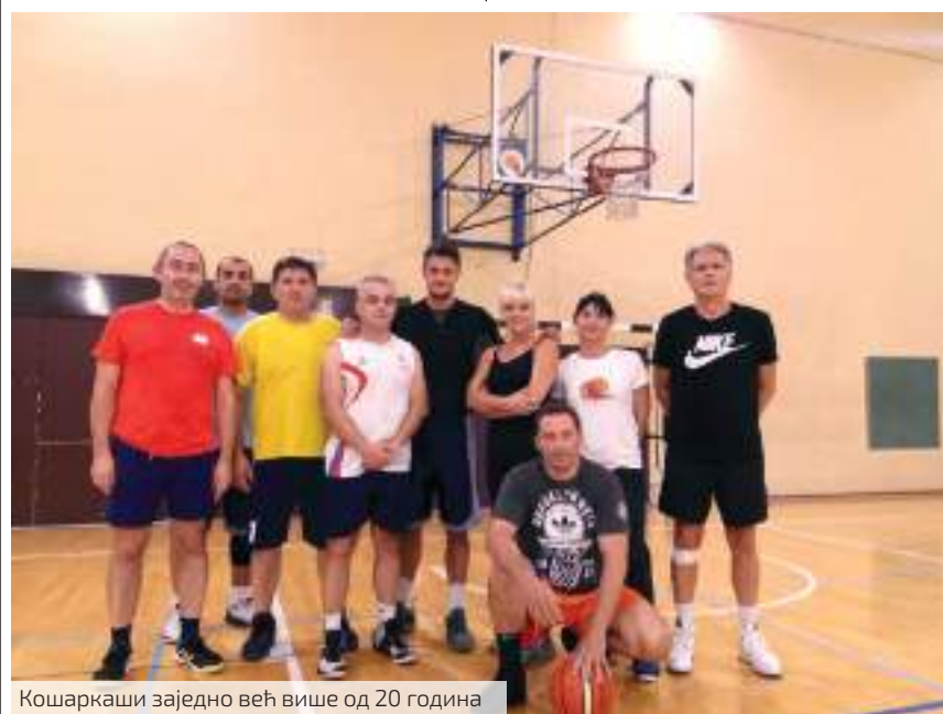
Кошаркаши заједно већ више од 20 година

обавезе или здравље допусте. Долазе сви профили, дакле радно место уопште није важно, јер под кошом су сви једнаки! Посебно истичемо да имамо